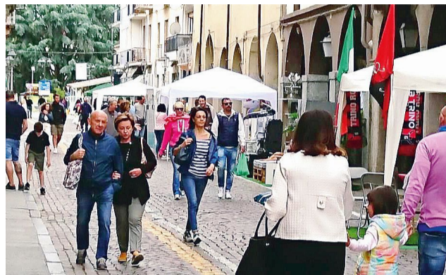
Trino in Piazza. L'edizione 2023 si terrà domenica 11 giugno