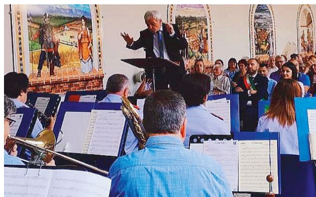
Trino. La banda musicale si è esibita a Palazzo Paleologo