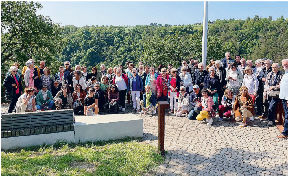
Comitato del Gemellaggio. La nutrita delegazione trinese alla Rocca della Lorelei durante una delle uscite