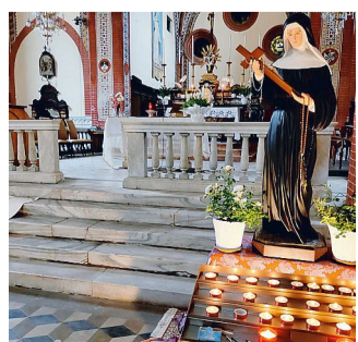
Festeggiamenti. Per Santa Rita