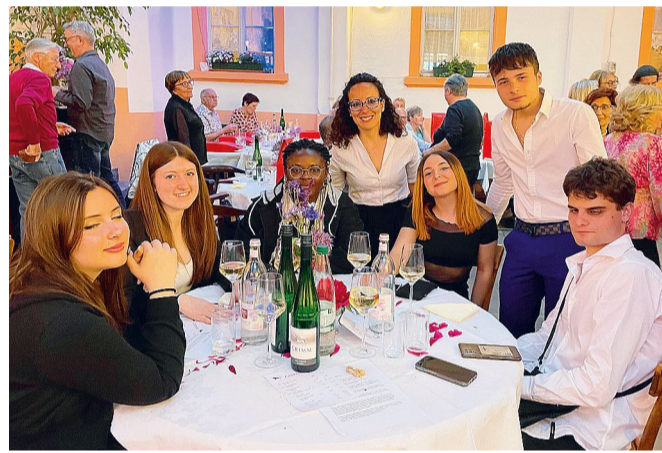
Viaggio a Geisenheim. Gli studenti dell'Artistico e dell'Alberghiero

In ritardo per il Covid festeggiati i 50 anni di gemellaggio tra francesi e tedeschi