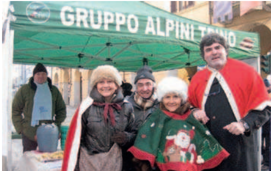
Un momento della raccolta fondi promossa sabato scorso a favore della scuola di Banfora

CON IL CLUB DEI BRUTTI, LA PRO LOCO E LA 24TRIN