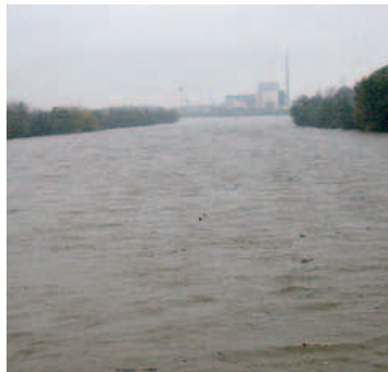
Un'immagine dell'ultima piena del fiume Po nel novembre 2011