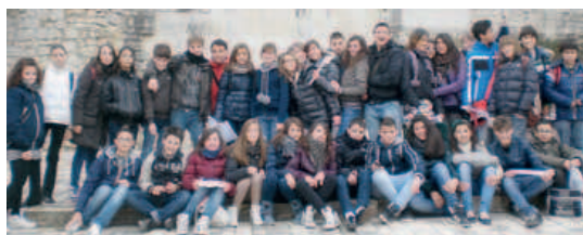
Un momento della trasferta a Chauvigny dei ragazzi dell'Istituto Comprensivo di Trino

Dal 20 al 27 marzo si è svolto lo scambio scolastico tra l'Istituto Comprensivo di Trino ed il Collège G. Philippe di Chauvigny. Trentacinque alunni delle classi seconde e terze, accompagnati da tre insegnanti, sono stati accolti dai loro corrispondenti francesi. Nel corso di una settimana i ragazzi trinesi hanno potuto immergersi in una realtà diversa dalla loro, vivere l'esperienza scolastica francese e conoscere le abitudini delle famiglie. Al mattino gli alunni sono stati inseriti nelle classi dei loro corrispondenti ed hanno par-