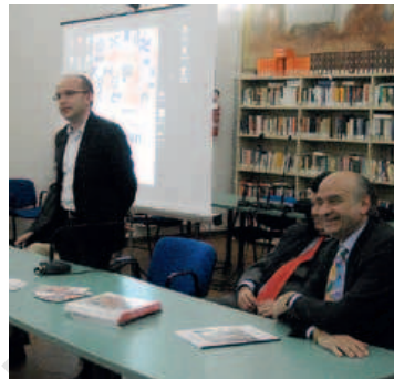
La tappa trinese degli «Appuntamenti Eccentrici»

particolarità specifica e rispettando quei preziosi giganti del passato che anche noi abbiamo a casa nostra». Fossale ha quindi raccontato l'avventura di una grande occasione che il Comune di Vercelli ha saputo cogliere, fin dal 2004. «Abbiamo subito intuito che la cultura era il mezzo migliore per fare diventare Vercelli conosciuta per i suoi giacimenti culturali che però da troppo tempo erano nascosti, se non addirittura abbandonati» ha spiegato l'assessore. «La progettualità, con la cultura come epicentro, è stato l'obiettivo da perseguire. Recuperare dei vecchi edifici è facile, ma poi è importante sapere come fare rivivere i locali recuperati. Non è stato affatto semplice fare diventare l'Arca un luogo di mostra con i livelli di sicurezza internazionale che vengono richiesti». L'Arca è in pratica un grande cassone che è stato appoggiato all'interno dell'ex chiesa di San