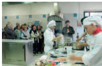
La visita all'interno della cucina dell'Istituto Alberghiero

▶▶ (mi) - Un pubblico numeroso e attento, venerdì pomeriggio ha preso parte al primo incontro del ciclo di conferenze "Anziani in salute, i venerdì del benessere", iniziativa promossa dal Comune di Trino in collaborazione con Asl-Al Ipab Sant'Antonio Abate, enti e associazioni trinesi. L'appuntamento inaugurale si è svolto all'interno degli accoglienti locali dell'Istituto Alberghiero di Trino e verteva sulla salute in tavola. Come relatori sono intervenuti il dott. Aldo Gellona, medico di famiglia e dietologo e la dottoressa Stefania Santolli, dietista del servizio igiene degli alimenti e della nutrizione di Casale. «Il cibo può essere considerato quasi come un farmaco nella nostra vita quotidiana» ha detto Gellona - e pertan-