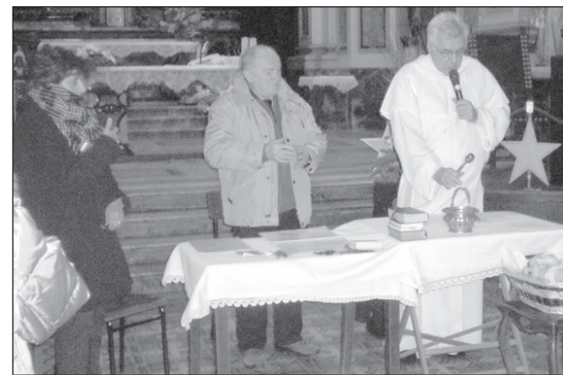
L'assegnazione in San Bartolomeo

La parrocchia di San Bartolomeo a Trino, nel pomeriggio di domenica 10 gennaio, ha ospitato l'assegnazione (mediante estrazione) di ben 204 Santi dell'Ordine domenicano.